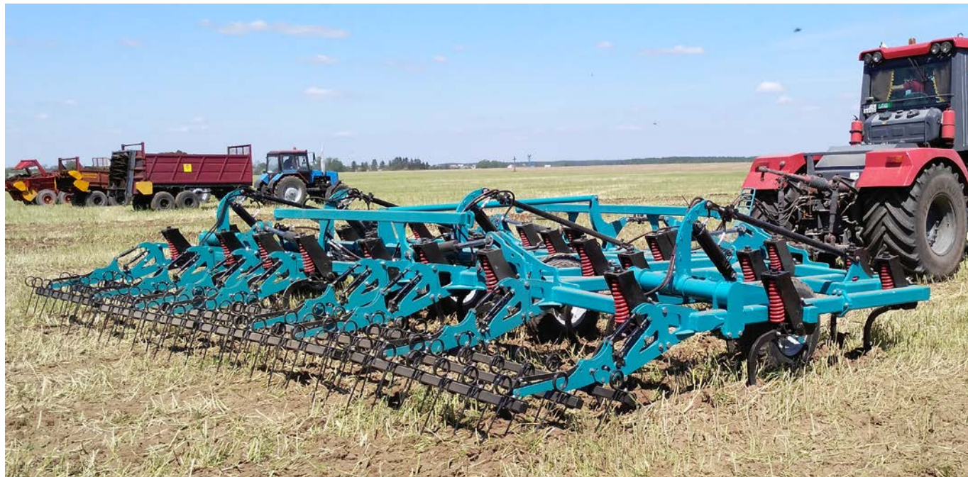
Рабочий орган культиватора